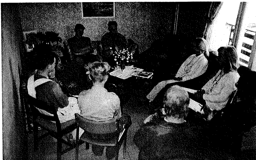
Stormöte – alla är med när beslut ska tas.

betongkasun för det ekologiska avloppssystemet. Vi närmar oss ytarbetet. På väggarna blir det glasfiberväv som målas. Fönstren kommer att behållas men slipas och målas. Nya golv ska