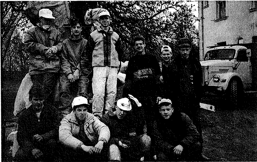
Våra pojkar vid bygget.

SEDAN DET FÖRRA NYHETSBRÉVET HAR MYCKET POSITIVT HÄNT MED PROJEKTET.