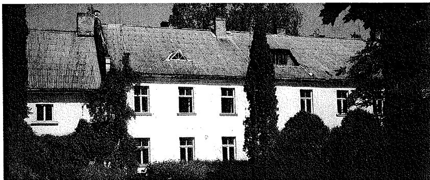
Livslust - Dzivesprieks-fastigheten i Aizupe