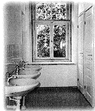
DEN TJUSIGA TOALETTEN MED "GULDHANDTAG" OCH GLÄNSANDE KRANAR.

"Ni kommer aldrig att få dem att arbeta. De är lata och kommer inte att lyfta ett finger." Innan projektet startade fanns