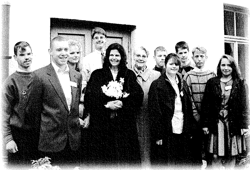
VÅRA FÖRSTA UNGDOMAR TILLSAMMANS MED DROTTNINGEN & FRU ULMANE INVIGNINGSDAGEN DEN 21 MAJ.

Årets händelse för oss förstås. Drottning Silvia och fru Aina Ulmane, hustru till Lettlands president, invigde projektet den 21 maj. Ingen, som inte var där i veckan före, kan ana den spända förväntan och febrila aktivitet som föregick begivenheten. Drottningen skulle komma i helikopter. Det var många hundra år sedan en drottning varit i denna landsända och en helikopter hade människorna i Vane bara sett en enda gång förut. Huset i Aizupe som skulle vara medelpunkten var långt ifrån färdigt och såg inte ut att kunna bli det på länge. Vädret hade inte varit nådigt. Snön låg meterhög in i april och tjälen var djup. Men det är otroligt