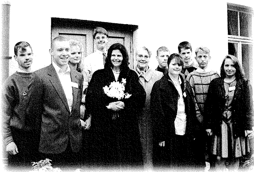
VÅRA FÖRSTA UNGDOMAR TILLSAMMANS MED DROTTNINGEN & FRU ULMANE INVIGNINGSDAGEN DEN 21 MAJ.

Årets händelse för oss förstås. Drottning Silvia och fru Aina Ulmane, hustru till Lettlands president, invigde projektet den 21 maj. Ingen, som inte var där i veckan före, kan ana den spända förväntan och febrila aktivitet som föregick begivenheten. Drottningen skulle komma i helikopter. Det var många hundra år sedan en drottning varit i denna landsända och en helikopter hade människorna i Vane bara sett en enda gång förut. Huset i Aizupe som skulle vara medelpunkten var långt ifrån färdigt och såg inte ut att kunna bli det på länge. Vädret hade inte varit nådigt. Snön låg meterhög in i april och tjälen var djup. Men det är otroligt