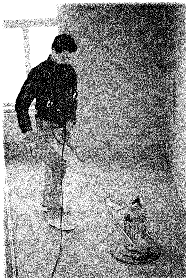
RYSKE IGORS SLIPAR GOLV.

Sovavdelningar, toaletter, badrum, kök och personalbostäder är nu färdiga. Det gamla sjukhuset går inte att känna igen. Aizupe har blivit ett utflyktsmål och vi vill gärna visa vad vi har åstadkommit. Dagiset i byn var på besök och de små gjorde stora ögon inför de ljusa färgerna, de