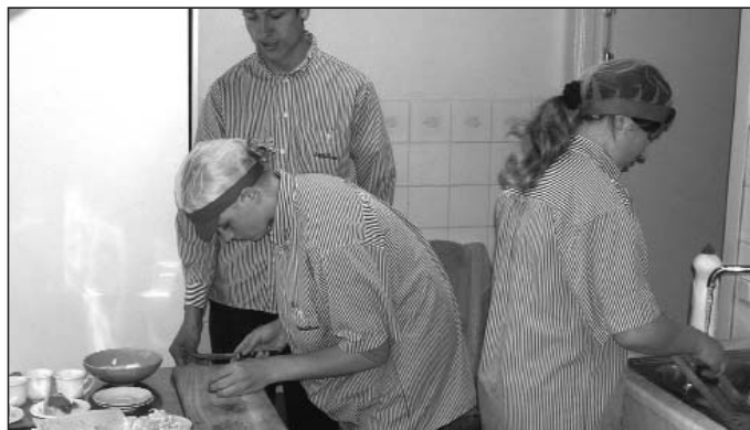
Kökseleverna koncentrerar sig på sitt examensprov

I år gick åtta kökselever ut och alla har antingen praktikplatser eller anställningar som väntar, flera hos Vairak Saules . Krasu Serviss har ordnat praktikarbete i sommar för alla målerieleverna. De två bästa får resa till Sverige och praktisera hos Colorex i Stora Levene. Tack vare stöd från Oriflame Cosmetics stipendiefond har några elever fått möjlighet att välja en annan utbildning utanför skolan.