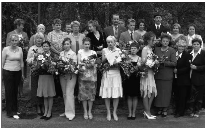
Livslusts lettiska personal tillsammans med examensfina elever