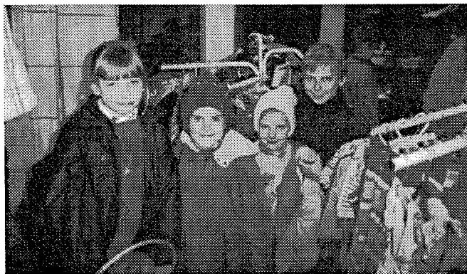
Barnen i byn träffas i Livslusts affär.

Ungdomar, som lämnar skolinstitutionerna löper stor risk att hamna på gatan med kriminalitet, drogmissbruk och prostitution som enda försörjningsmöjlighet. Hos Livslust förbereds de till ett värdigt liv genom social rehabilitering och yrkesutbildning. (Använd gärna bifogad kupong.)